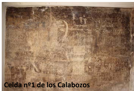
Celda nº1 de los Calabozos